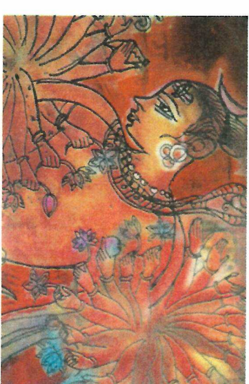
Photo d'une peinture offerte par Shiva Gurji à la rédaction de Destinée : Les donateurs reçoivent : le mot de Shiva Gurji. Ainsi Shiva reçoit en main gauche et redonne en main droite.

“ Rencontre avec un grand Maître spirituel Père fondateur du Shiva Dhyan Yoga.”